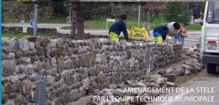
AMENAGEMENT DE LA STELE PAR L'ÉQUIPE TECHNIQUE MUNICIPALE