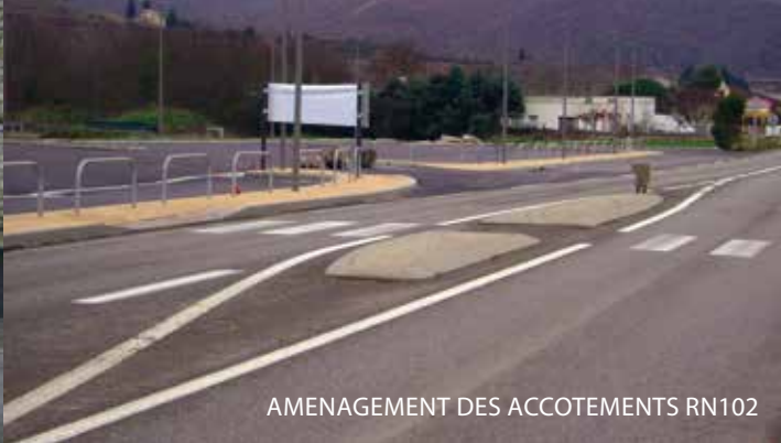
AMENAGEMENT DES ACCOTEMENTS RN102