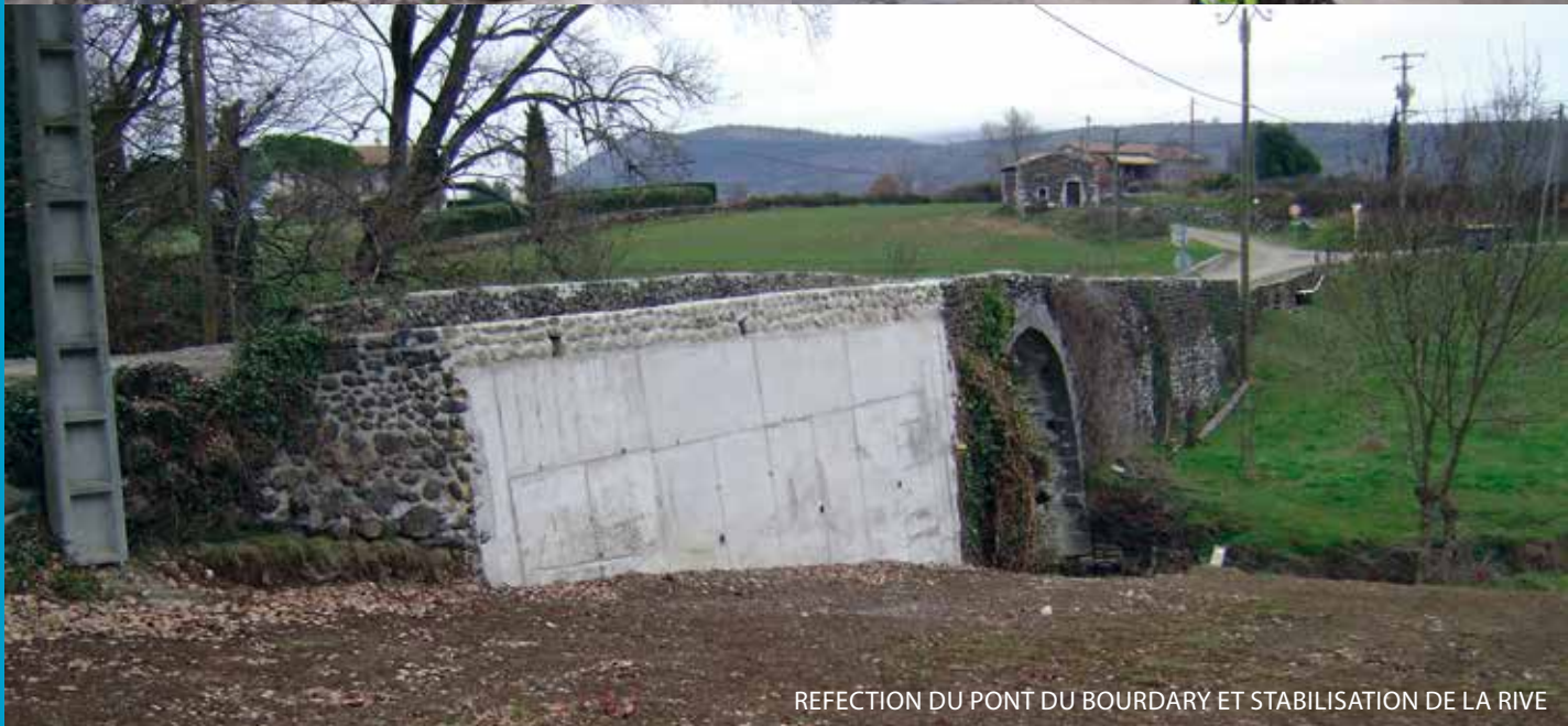
REFECTION DU PONT DU BOURDARY ET STABILISATION DE LA RIVE