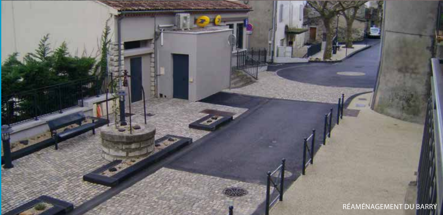
RÉAMÉNAGEMENT DU BARRY