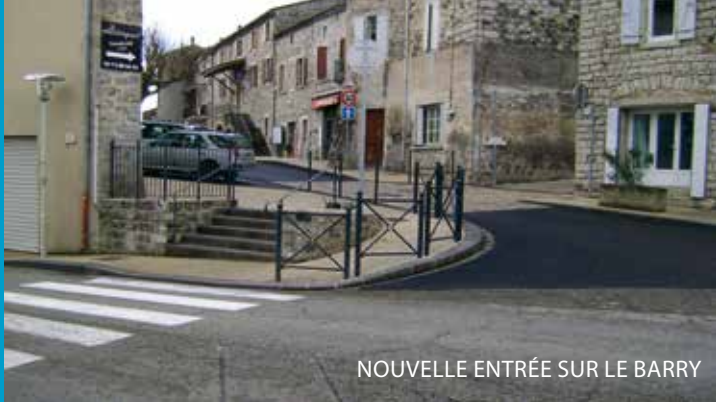
NOUVELLE ENTRÉE SUR LE BARRY