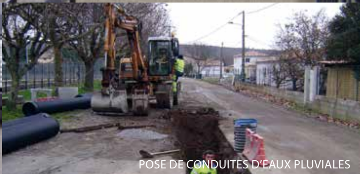
POSE DE CONDUITES D'EAUX PLUVIALES